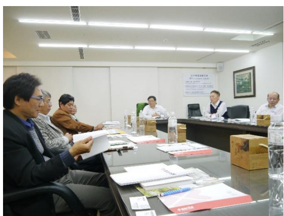
院長與教師參訪國睦工業(一)