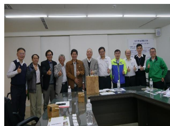
院長與教師參訪國睦工業(三)