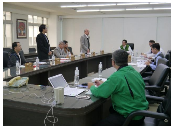
院長與教師參訪國睦工業(二)